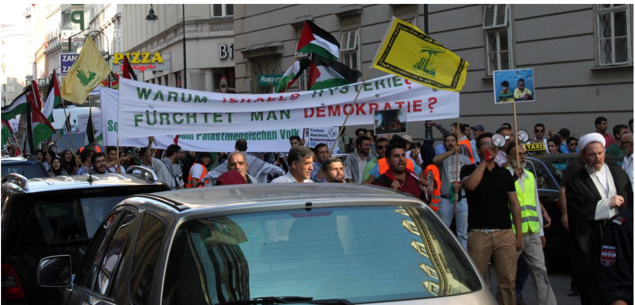
Abb. 2: Al-Quds-Marsch 2012 in Wien

2012 gab es erstmals auch eine Demonstration gegen den Al-Quds-Tag unter dem Motto „No Al Quds“. 35 In den anschließenden Jahren lenkten Proteste verschiedener linker und antisemitismuskritischer Bündnisse das öffentliche Interesse auf die Wiener Al-Quds-Aufmärsche. Auslöser waren offen antisemitische Aufrufe und Parolen, die im Vorfeld der Al-Quds-Aufmärsche als auch bei diesen Anlässen selbst getätigt wurden.